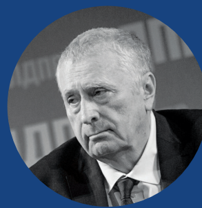
Основатель ЛДПР Владимир Вольфович Жириновский 2017 год

«Мы придерживаемся традиционного понимания патриотизма. Это горячая любовь к своей Родине, своему народу, это память о его историческом прошлом, гордость за великие деяния предков».